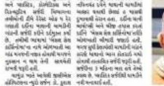
સામડીની ગૃહ યાત્રા GCS હોસ્પિટલના પાર્ટીકલ સર્જરી કરાઈ.