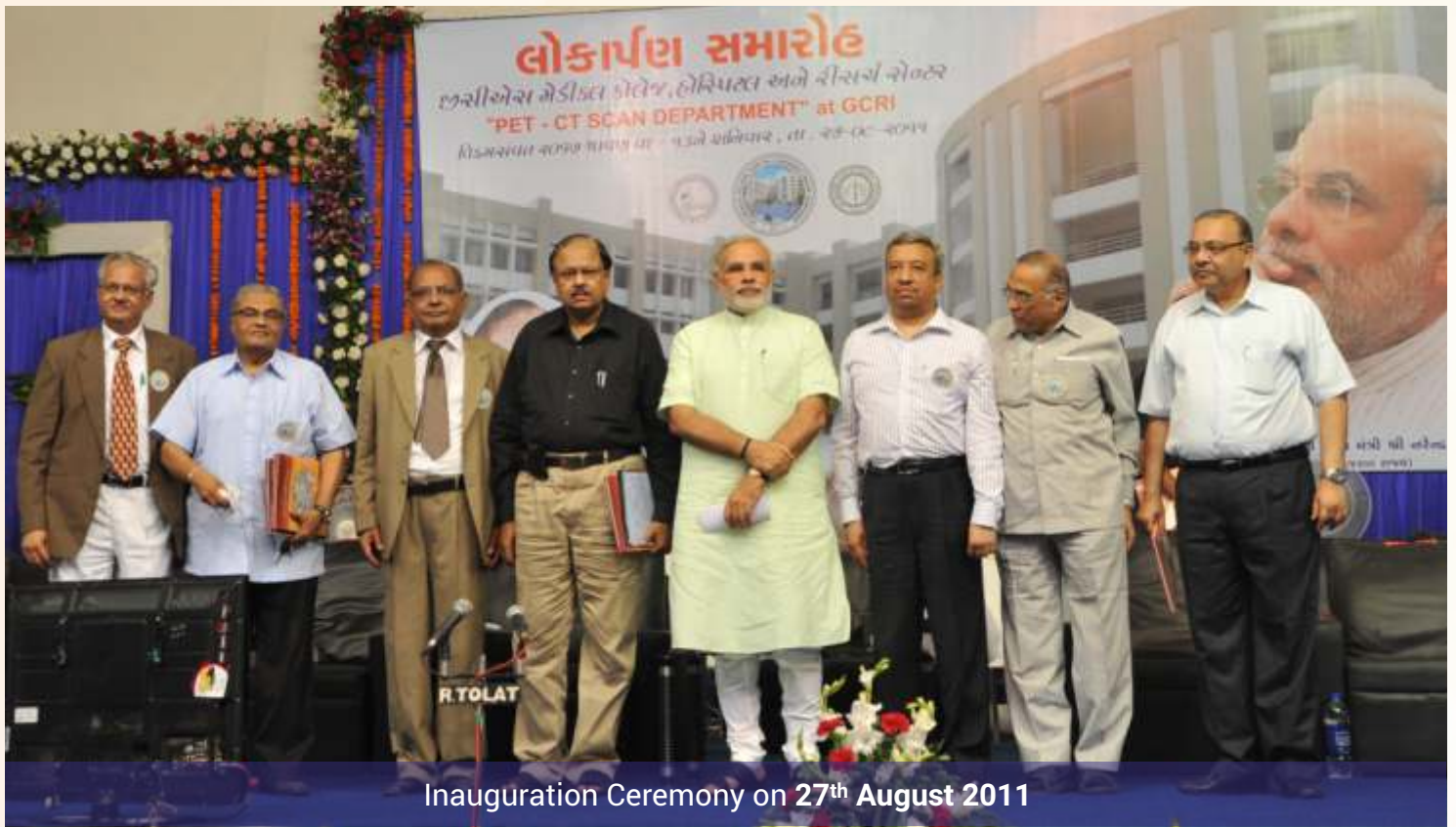
Inauguration Ceremony on 27 th August 2011