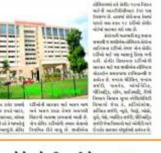
કોરોના વચ્ચે જુસીએસ હોસ્પિટલ દ્વારા કરાઈ ૬૦૦૦ કોવિડ દર્દીઓની સારવાર.

ગુજરાતી સંસ્થા, અમદાવાદ કોરોના વચ્ચે જુસીએસ હોસ્પિટલ દ્વારા કરાઈ ૬૦૦૦ કોવિડ દર્દીઓની સારવાર. આ અમૂલ્ય ભેટ તરીકે ગ્રાહકોને વિના મૂલ્યે સારવાર પૂરી પાડશે.