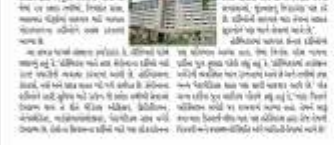
કપરા દ્વારા કોરોનાની સારવાર માટે નિયુક્ત કરાયેલી હોસ્પિટલ કોરોના આક્રમણ હાલમાં સારવાર કરી રહી છે.

કપરા દ્વારા કોરોનાની સારવાર માટે નિયુક્ત કરાયેલી હોસ્પિટલ કોરોના આક્રમણ હાલમાં સારવાર કરી રહી છે. આ અમૂલ્ય ભેટ તરીકે ગ્રાહકોને વિના મૂલ્યે સારવાર પૂરી પાડશે.