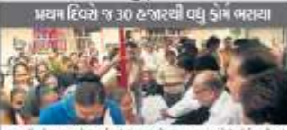
પ્રથમ દિવસે ૧૩૭ હજારથી વધુ કામગીરી થઈ

અમદાવાદ શહેરના છેટ લાખ રત્નલાલાકારોને નવા વર્ષની અમૂલ્ય ભેટ તરીકે ગ્રાહકોને વિના મૂલ્યે સારવાર પૂરી પાડશે. આ અમૂલ્ય ભેટ તરીકે ગ્રાહકોને વિના મૂલ્યે સારવાર પૂરી પાડશે. આ અમૂલ્ય ભેટ તરીકે ગ્રાહકોને વિના મૂલ્યે સારવાર પૂરી પાડશે.